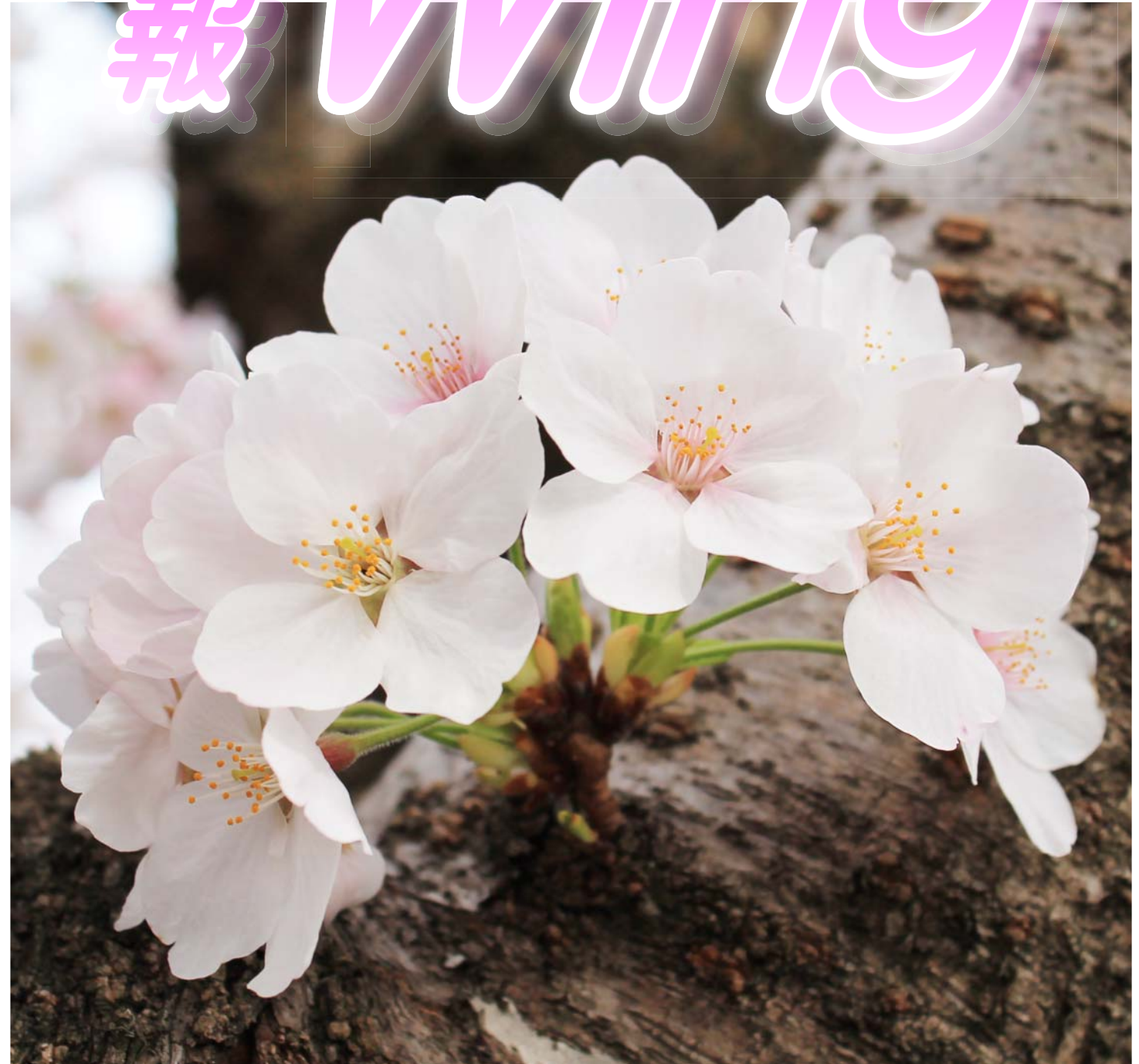
島原城の桜