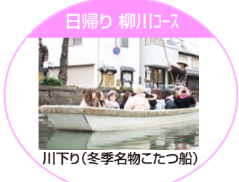
日帰り 柳川コース