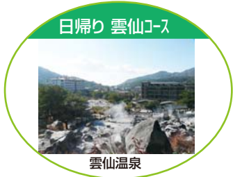
日帰り 雲仙コース