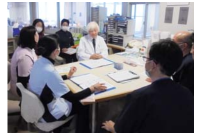
NSTカンファランスの様子