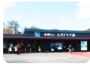
大河ドラマ館西郷どん