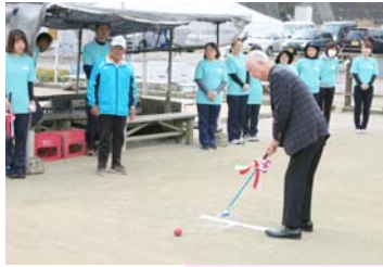
ゲートボール大会の様子

さわやかな秋晴れの空の下、第22回ウイングカップゲートボール大会が、杉谷地区中尾川河川敷にて開催され、各チームそれぞれの持ち味を生かした戦い方で、コート内は10月とは思えない熱い戦いが繰り広げられました。