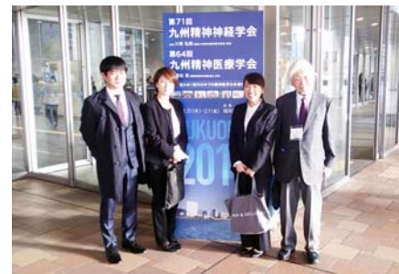
福岡国際展示場前にて

2019年1月31日・2月1日、福岡国際展示場にて「第64回九州精神医療学会」が開催され、当法人から以下の3題を発表しました。次回の開催へ向けて、また準備を続けて行きたいと思っております。