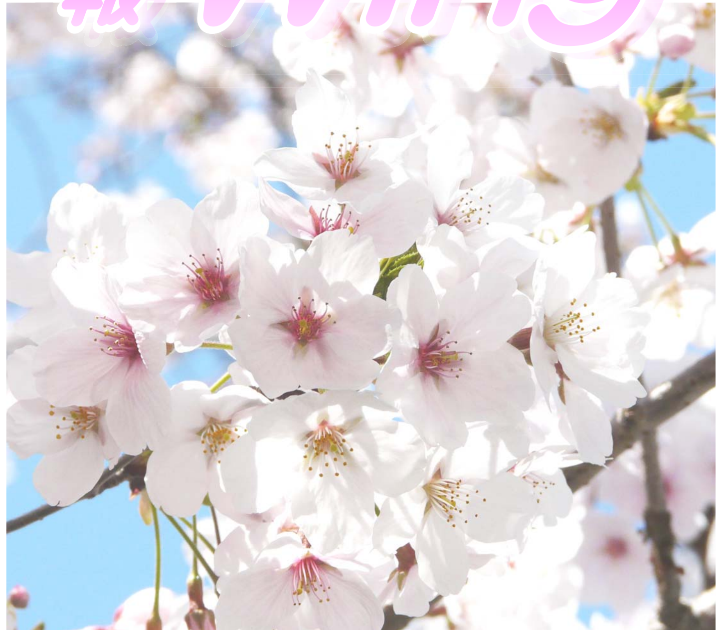
島原城の桜

広報WING Vol.39 発行:医療法人ウイング高城病院/島原市中野町丙1165番地 TEL0957-62-3105 FAX0957-63-7743 2018年4月11日発行