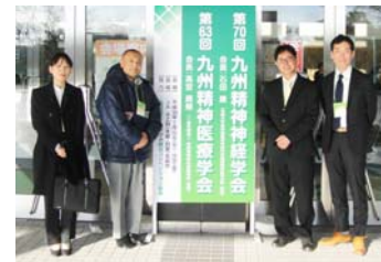
宮崎JA・AZMホール前にて

2018年1月25日・26日、宮崎JA・AZMホールにて「第63回九州精神医療学会」が開催され、当法人から以下の3題を発表しました。次回の開催へ向けて、また準備を続けて行きたいと思えます。