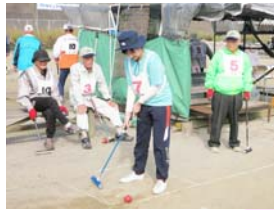
ゲートボール大会の様子

高く澄み切った秋晴れの素晴らしい気候の中、杉谷地区中尾川河川敷での開催となりました第21回ウイングカップゲートボール大会でしたが、各コートの中は夏を思わせるような熱い戦いが繰り広げられました。