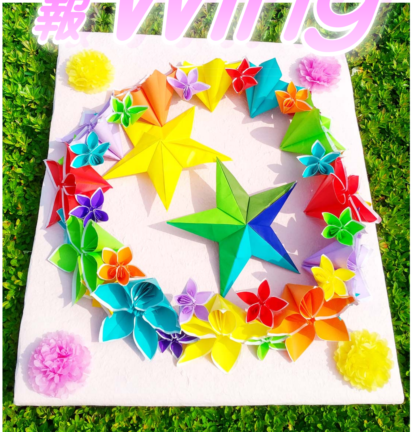
患者さんの作品より (OT活動)