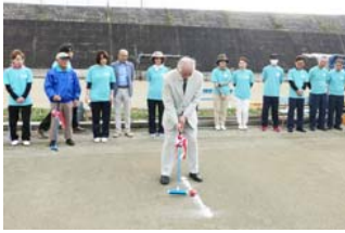
ゲートボール大会の様子

秋晴れの素晴らしい気候の中、今回は第20回目となる記念大会となりました。熱戦が繰り広げられた結果、優勝は大三東、準優勝は中原、三位は中野でした。