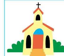
グラバー園・大浦天主堂