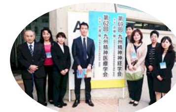
沖縄コンベンションセンターにて

2016年12月1日・2日、沖縄コンベンションセンターにて「第62回九州精神医療学会」が開催され、当法人から以下の4題を発表しました。次回の開催へ向けて、また準備を続けて行きたいと思えます。