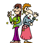
鳥栖プレミアムアウトレット