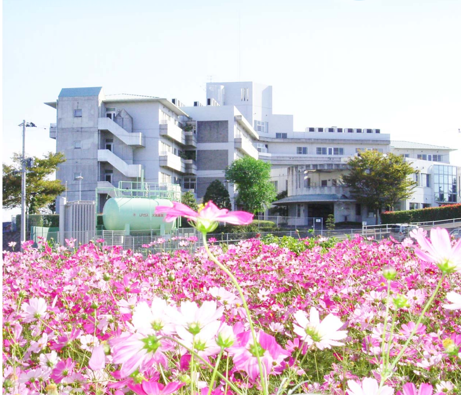
裏から見た病院

医療法人ウイング 高城病院 高城病院ホームページ/ www.takagihp.or.jp Eメールアドレス/ wing@takagihp.or.jp